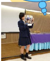
看護科の授業について プレゼン中!